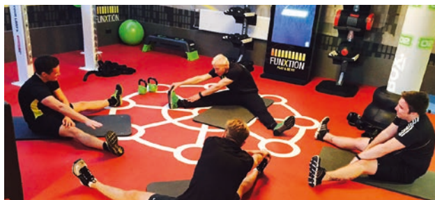
Das Ausstattungshighlight ist die Experience Station von FunXtion, die über einen virtuellen Trainer verfügt und dem Training einen spielerischen Charakter in Form von Challenges verleihen soll