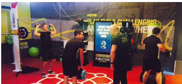
Betreuung durch Trainer ist in dem Selfservice-Gym nicht vorgesehen. Lediglich ein- bis zweimal monatlich finden Einweisungen durch Master Trainer der HDD Group statt