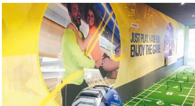
Der Schwerpunkt des Konzepts liegt auf Functional Training